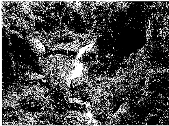
「白糸の滝」(廿日市市宮島町・JR宮島口駅)