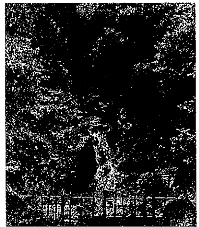
「三滝」(広島市西区三滝山・JR三滝駅)