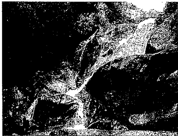
「妹背の滝」(廿日市市大野・JR大野浦駅)

暑い日々が続きます。鈴が峰町からもJRで気軽に行くことのできる「滝」をいくつか探してみました。人ごみを避けて、涼しさを感じてみませんか？